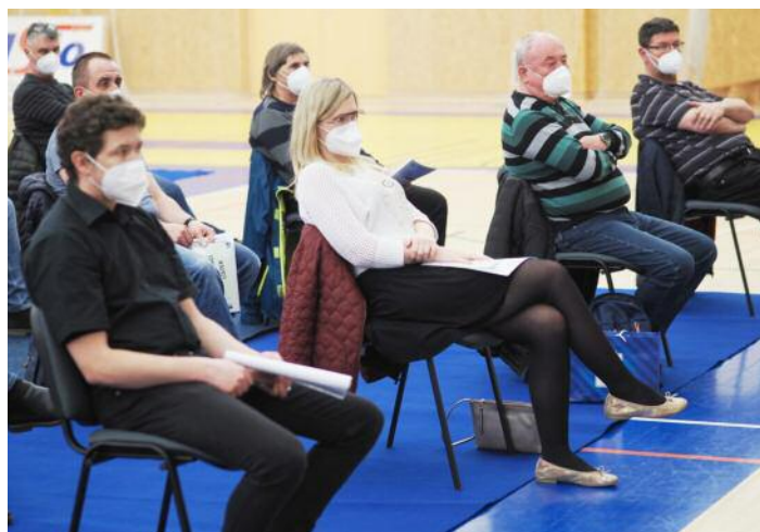
Delegáti volební valné hromady OFS Hradec Králové ve sportovní hale Třebeš.