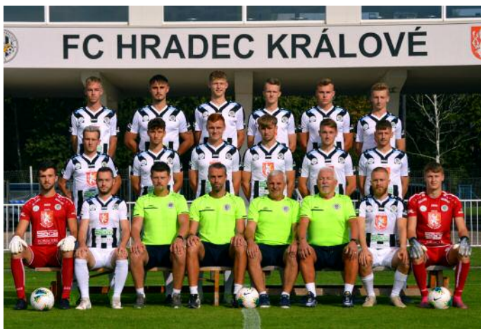
Tým FC Hradec B působí ve třetí nejvyšší soutěži.