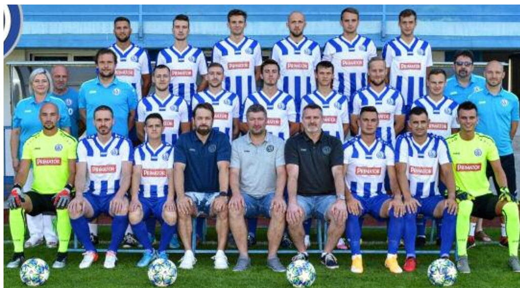
Náchod hrál na podzim v divizi velmi dobře, drží se na druhém místě.