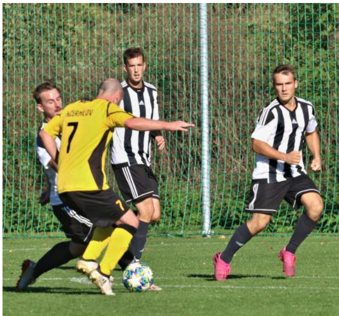
V přeboru se Hořice potkávají i s týmem Černilova.