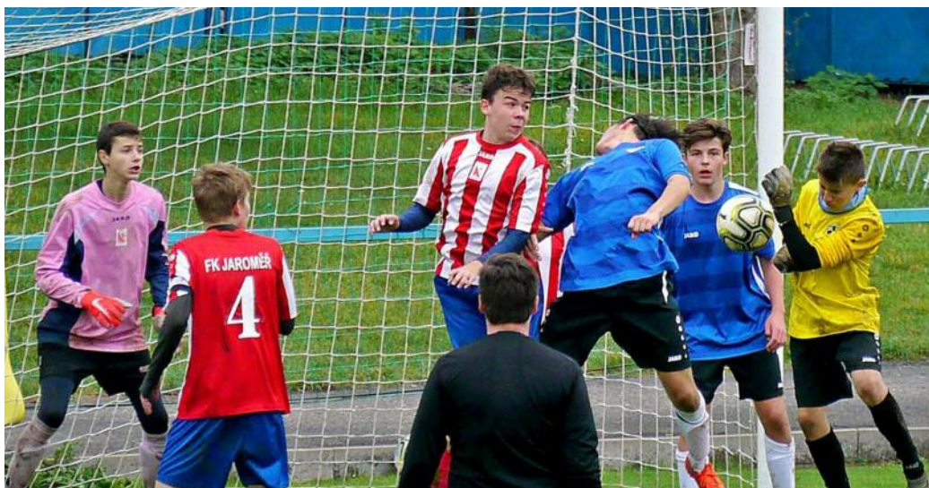
V krajském přeboru mladšího dorostu se Jaroměř poměřila také s Vysokým Mýtem.

K dispozici jsou dvě travnatá hřiště a jedno menší s umělou trávou. Při tréninku lze používat mnoho tréninkových pomůcek. Na stadionu vyrostla nová tribuna. Ještě upravit stávající kabiny a myslím, že podmínky budou ideální. Plány nového vedení jsou velké. Uvidíme, jak se je podaří realizovat. (pvh)