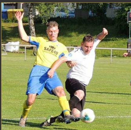
■ Ve skupině C AGRO CS poháru zdolal Nový Hradec Roudnici 4:1.