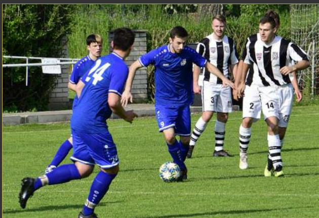
■ V Covid turnaji na Rychnovsku remizovaly Doudleby s Borohrádkem 0:0.