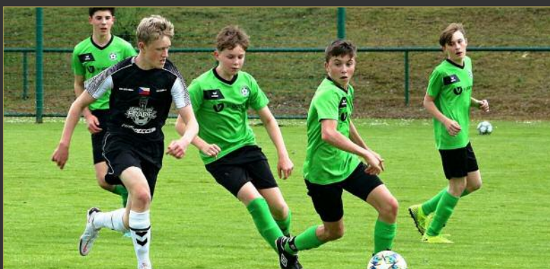
■ Ve skupině B letního poháru AGRO CS starších žáků prohrál doma tým Miletín/Javorka s Novým Hradcem 0:6.