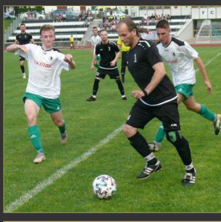
■ V poháru AGRO CS udolal Rychnov nad Kněžnou Solnici až po penaltovém rozstřelu 3:2.