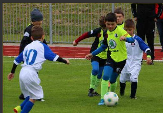
■ V zápase letního poháru mladších přípravků na Rychnovsku se poměřil Spartak Rychnov s Kostelcem nad Orlicí.