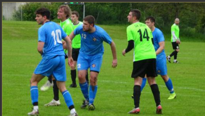
■ V Memoriálu Karla Medlíka prohrál Jičín v Železnici (v modrém) 0:1.