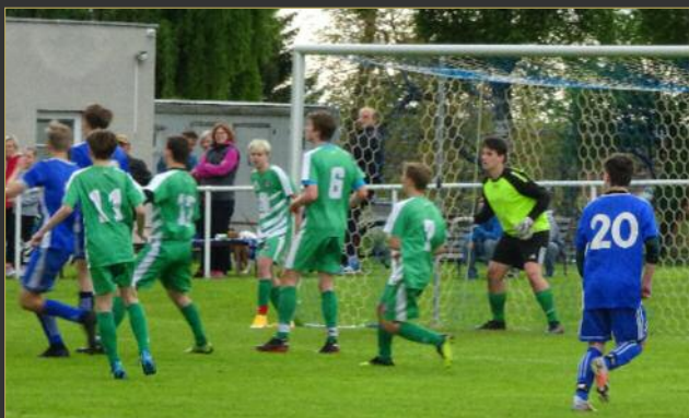
■ V dorostenecké části Memoriálu Karla Medlíka podlehla Železnice (v zeleném) Jičínu 3:6.