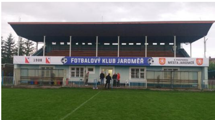
Takhle povedeně vypadá zrekonstruovaná tribuna v Jaroměři. Její kapacita je 200 diváků.