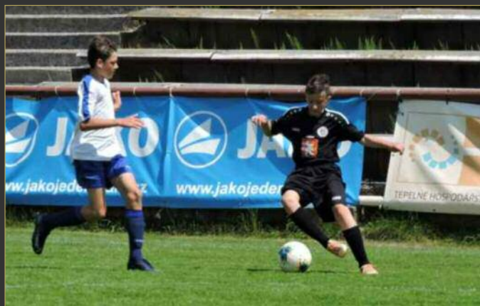
■ Ve skupině A AGRO CS poháru starších žáků si FC Hradec (v černém) poradil s Cidlínou jasně 12:1.