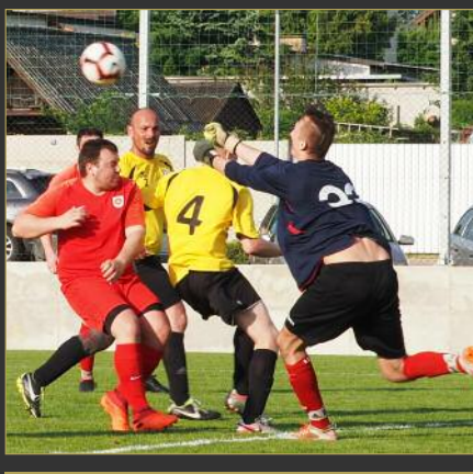
■ Ve čtvrtfinále královéhradeckého Votrok Cupu podlehly Nechanice (v červeném) Vysoké nad Labem B 1:3.